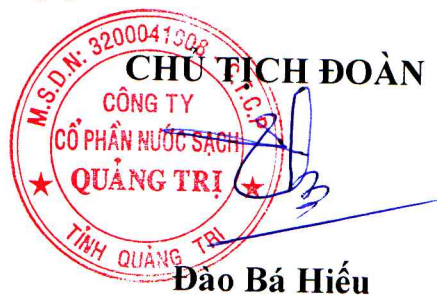
Đào Bá Hiếu